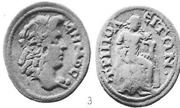
Levha 3: Tripolis III.3