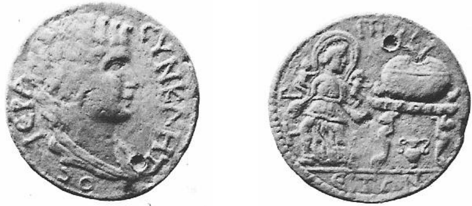
Levha 5: Tripolis III.8