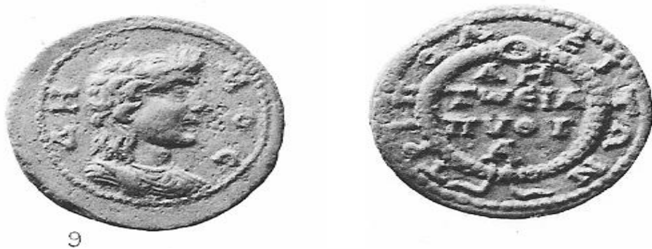
Levha 6: Tripolis III.9