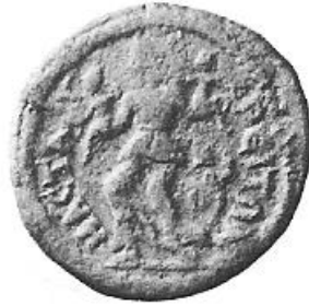
Levha 1 Mastaura I.1