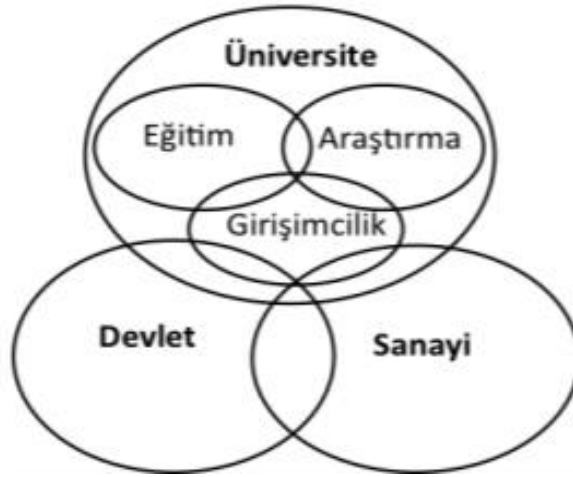
Şekil 1: Akademik Girişimci ve Yenilikçi Üniversite Modellemesi

Akademik girişimler, ek kazanç sağlayarak üniversitelerin gelişimine katkı sağlamaktadır. Akademik girişimlerin bir diğer faydası ise istihdam olanaklarını arttırmaları ve bölgesel ekonomiye katkılarıdır. Akademik girişimler, yeni kaynaklar oluşturdukları için üniversitelerde teknolojik gelişimi artırır ve bu yeni teknolojilerin pazarlanmasını da kolaylaştırırlar. Oluşturulan yeni pazarda, çok az harcamalarla yüksek getirili ürün/hizmet üretimini sağlar. Bu sayede çok sayıda yeni öğrenci ve öğretim üyesinin dikkatini çekerek, organizasyonlara katılım ile birlikte yeni girişimcilerin de eğitim alması sağlanmış olur (İskender, 2016: 57). Aşağıda şekil 1’de akademik girişimciliği destekleyen, girişimci ve yenilikçi üniversitenin modellenmesi verilmiştir.