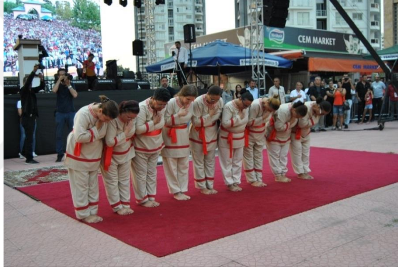
Resim 13. 15.09.2019 Aşure Şenliği Kadın Semah Ekibi