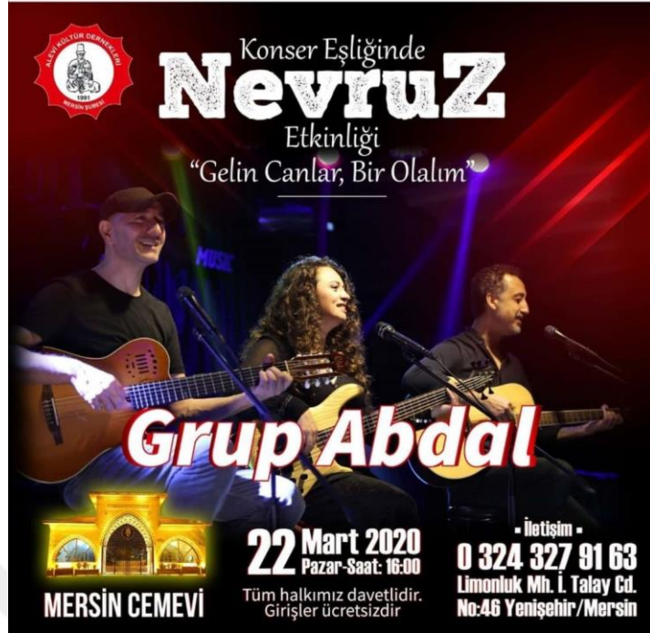
Resim 17. Mersin Cemevi Nevruz Etkinliği Duyuru Afışı