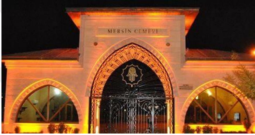
Resim 10. Mersin Cemevi Dış Giriş Kapısı