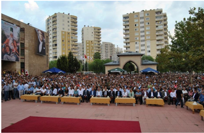
Resim 14. 15.09.2019 Aşure Şenliği