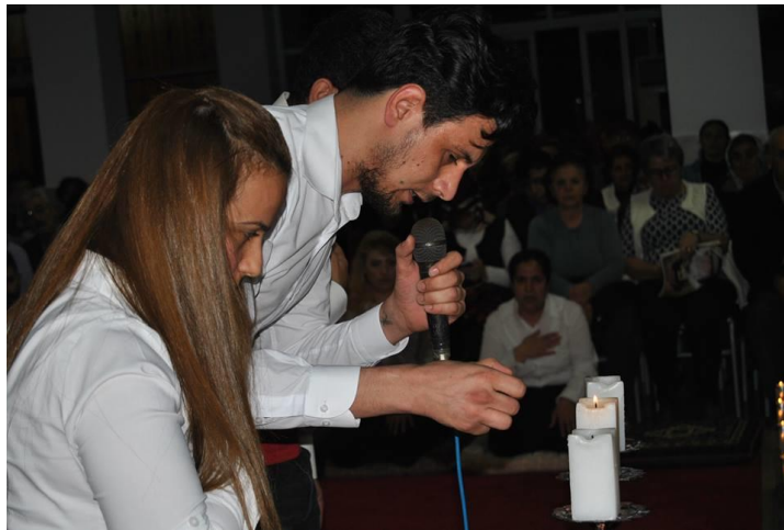
Resim 11. Cem töreni sırasında Çerağcı mumları yakarken