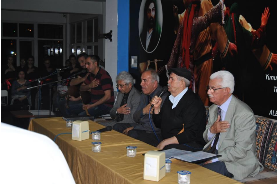
Resim 9. Mersin Cemevi Cem Töreni, Zakirler ve Dedeler