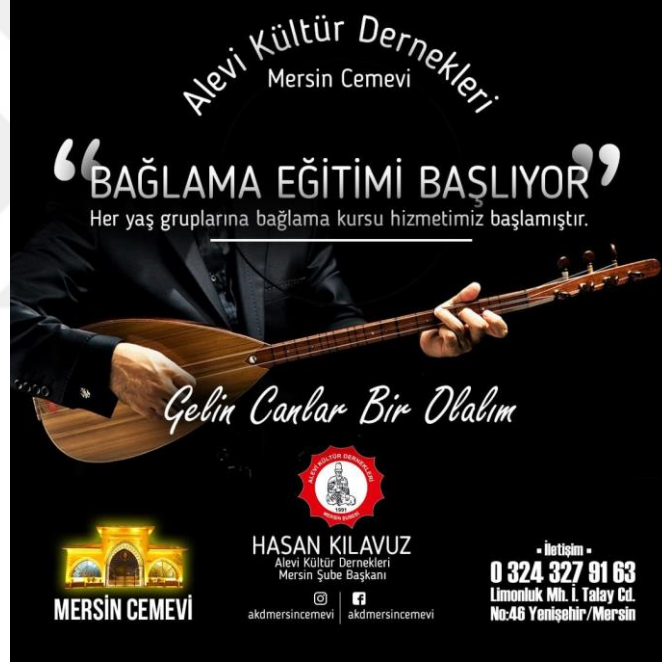
Resim 16. Mersin Cemevi Bağlama Kurs Afişi