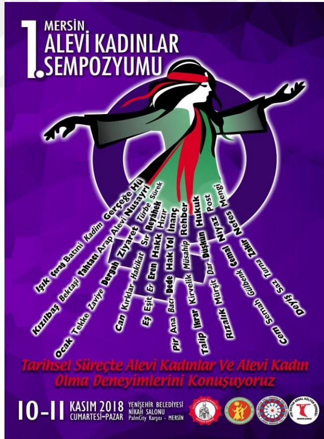
Resim 18. Mersin Cemevi Kadın Kolları Sempozyum Afışı