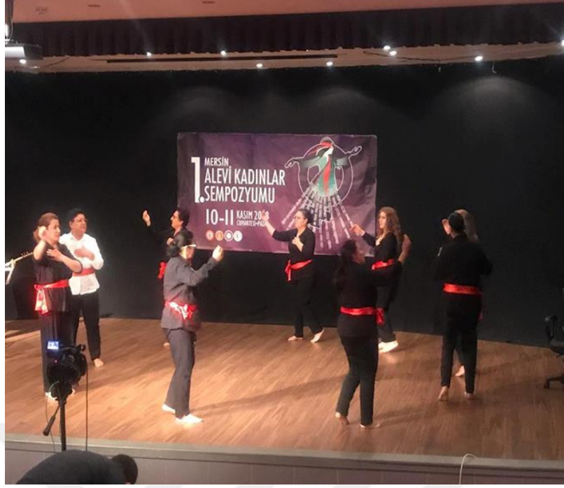
Resim 19. Kadın Kolları Sempozyumundan