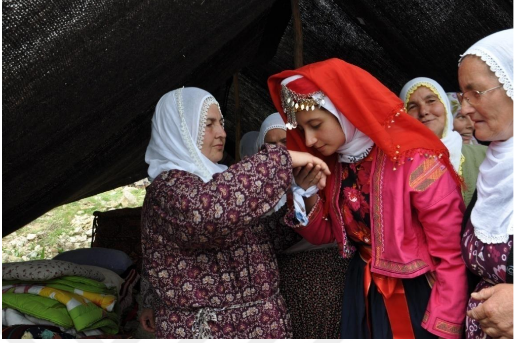
EK-18. Gelin Olacak Kızın Kına Töreni