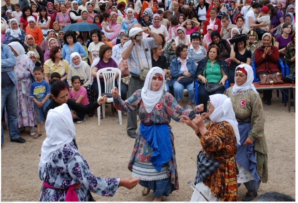
EK-24. Yöresel Kıyafetle Düğünde Oynayan Kadınlar