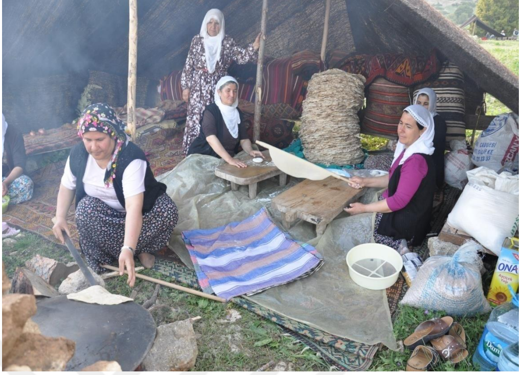
EK-20. Düğün Öncesi Ekmek Yapımı