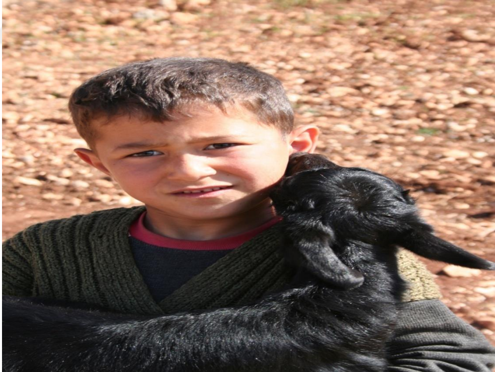
EK-13. Bir Yörük ocuęu ve Yeni Doęmuş Oęlak