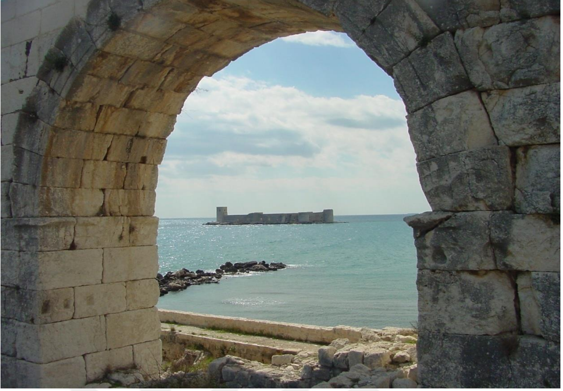
EK-8. İç Kaleden Kızkalesi'nin Görünümü