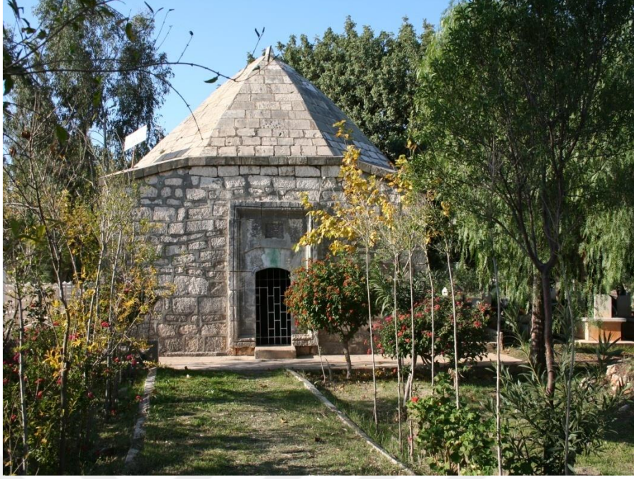
EK-6. Erdemli Paşa Türbesi