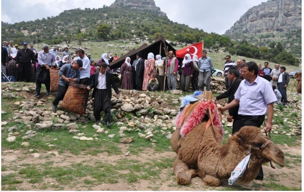
EK-22. Toroslarda Düğün