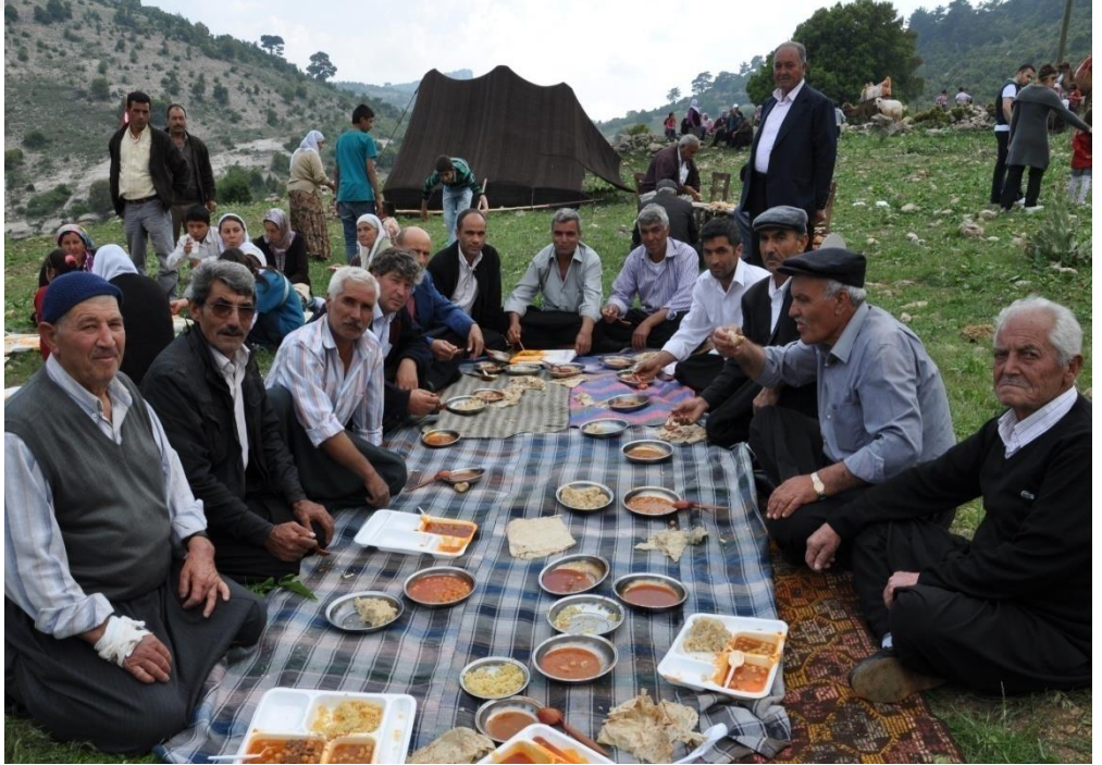
EK-21. Bir Merasim Sonrası Yemek