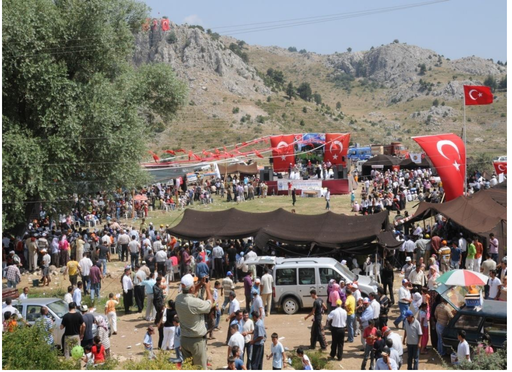
EK-11. Erdemli'de Yayla Şenlikleri