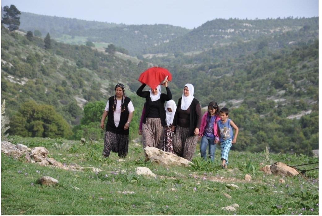
EK-19. Gelin Bohçasının Taşınması