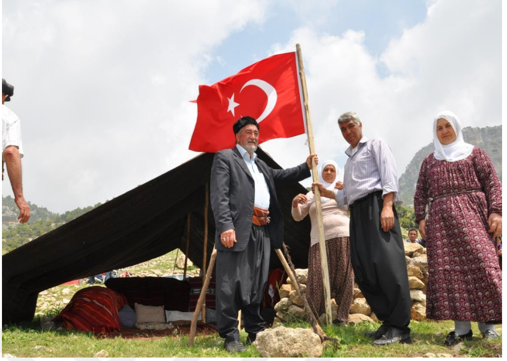
EK-16. Düğün Bayrağı Dikme