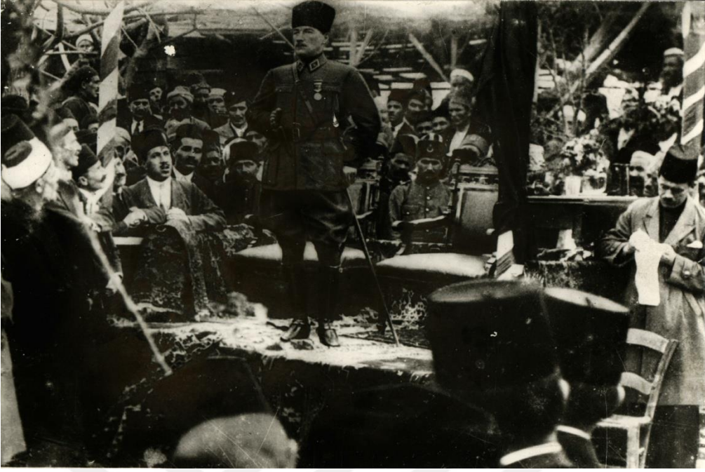
EK-2. Atatürk Erdemli’de Halka Hitap Ediyor