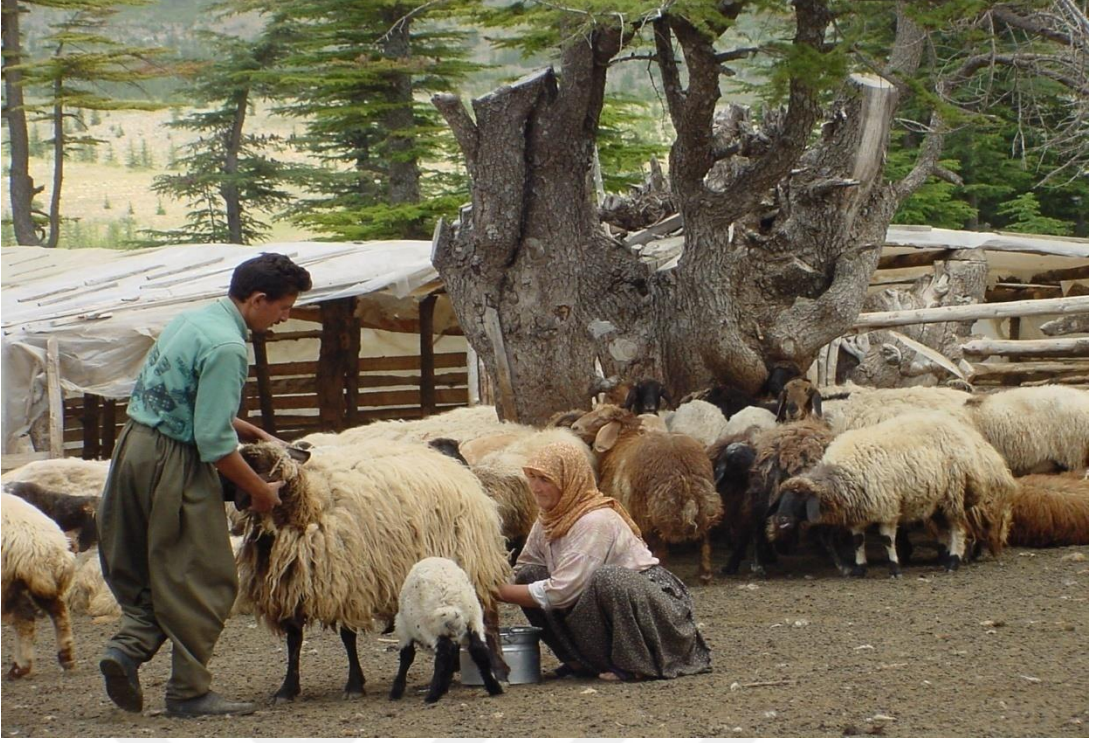
EK-10. Erdemli Toroslarda Hayvancılık