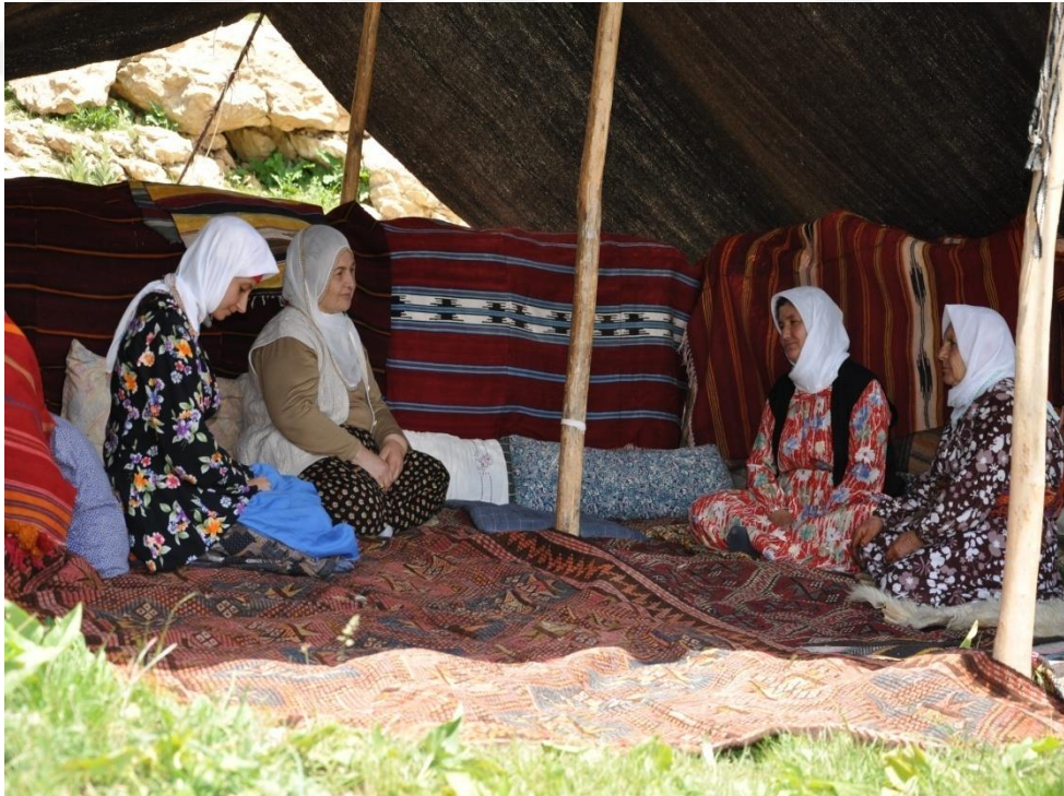
EK-15. Yörük Çadırında Düğün Hazırlığı Yapan Yörük Kadınları