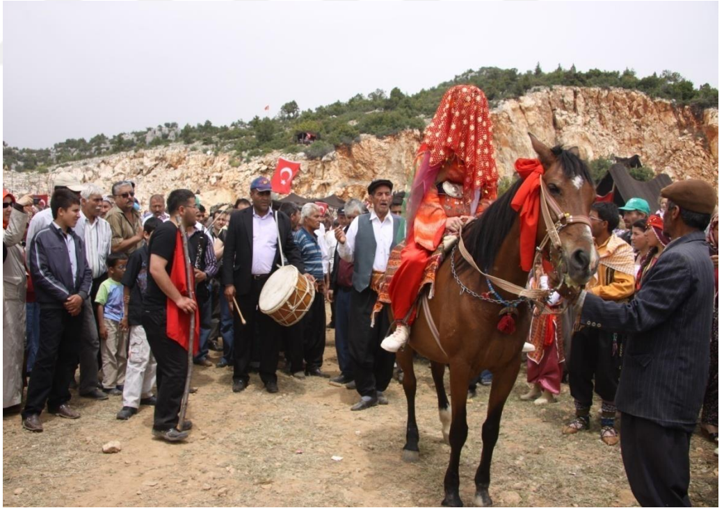
EK-23. At Üzerinde Bir Gelin