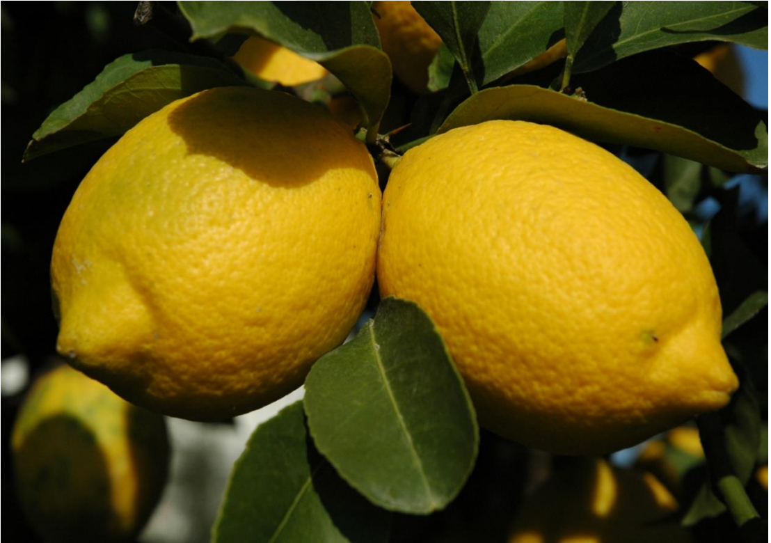
EK-9. Erdemli'nin Meşhur Tarım Ürünü Limon