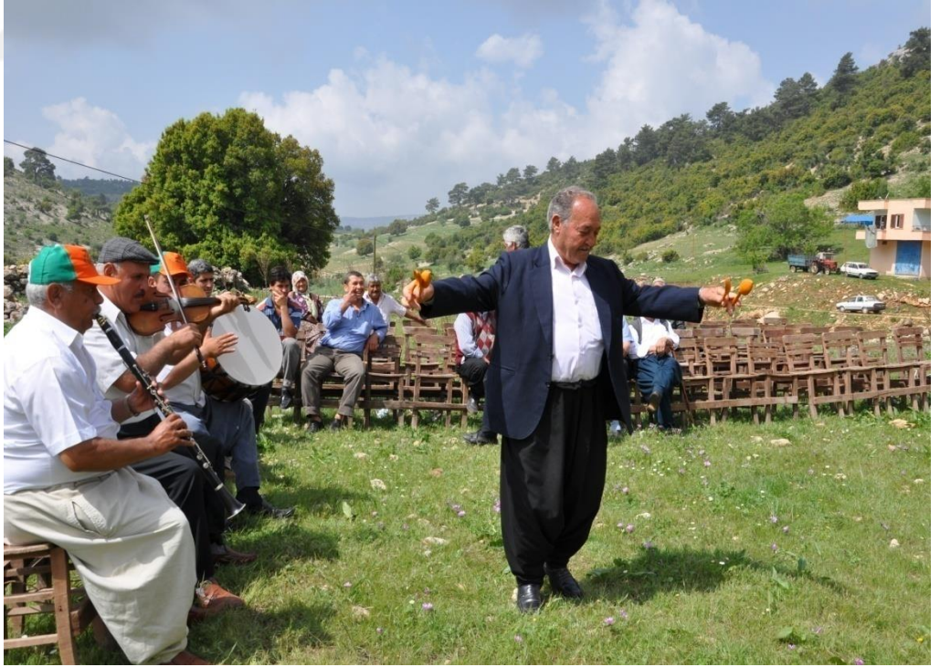
EK-17. Erdemli’de Yörük Düğününden Bir Fotoğraf