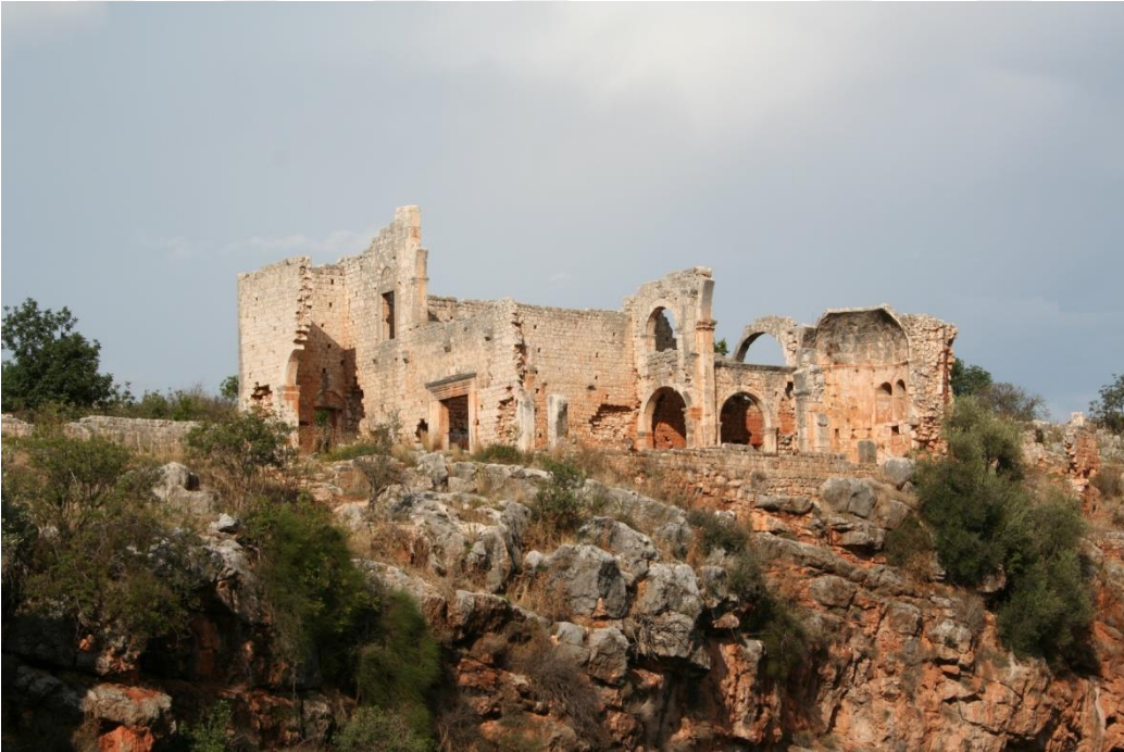
EK-5. Erdemli Kanlıdivane Harabeleri