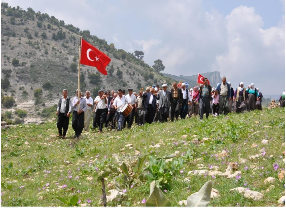
EK-14. Erdemli’de Gelin Alma Töreninden Bir Resim