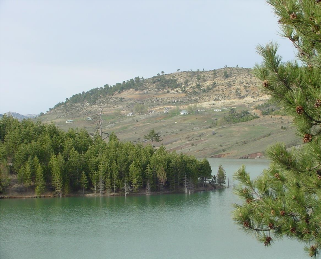
EK-3. Erdemli Karakız Göleti