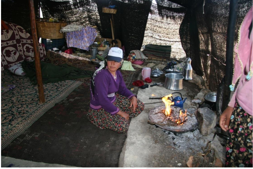
EK-12. Kara adır