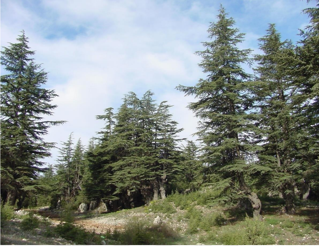
EK-4. Erdemli Toroslarda Sedir Ağaçları