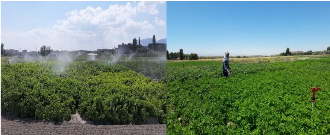
Fotoğraf 3.6. Denemede sulama ve gübreleme uygulamalarından görüntüler