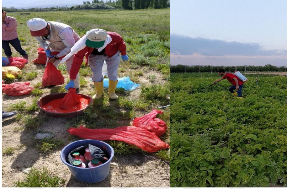
Fotoğraf 3.7. Patates böceğine karşı dikim öncesi ve sonrası ilaçlama görüntüleri

Çalışmada, tüm parsellerde çıkışların olmasıyla beraber traktörle ara çapası ve boğaz doldurma işlemi gerçekleştirilmiştir. Yetiştirme dönemi içerisinde patates böceği ile mücadele amacıyla 2 kez Coragen 20 SC (200 g/l Chlorantraniliprole) ve bir kez de Tayson (240 g/L Thiamethoxam) ile ilaçlama yapılmıştır (Fotoğraf 3.7.).