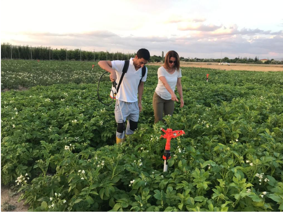
Fotoğraf 3.4. Denemenin ana konusu olan GA3 uygulamasından görüntü