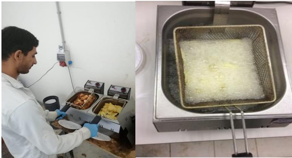
Fotoğraf 3.14. Hasat edilen yumruların cips ve parmak patates renk ölçümü

000-00-0 = Çok iyi, 1 = İyi, 2 = Orta-iyi, 3 = Orta (max %30), 4 = Düşük (max %10 ) gruplama şekline göre belirlenmiştir.