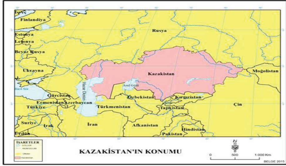
Ek1: Kazakistan'ın Coğrafi Konumu