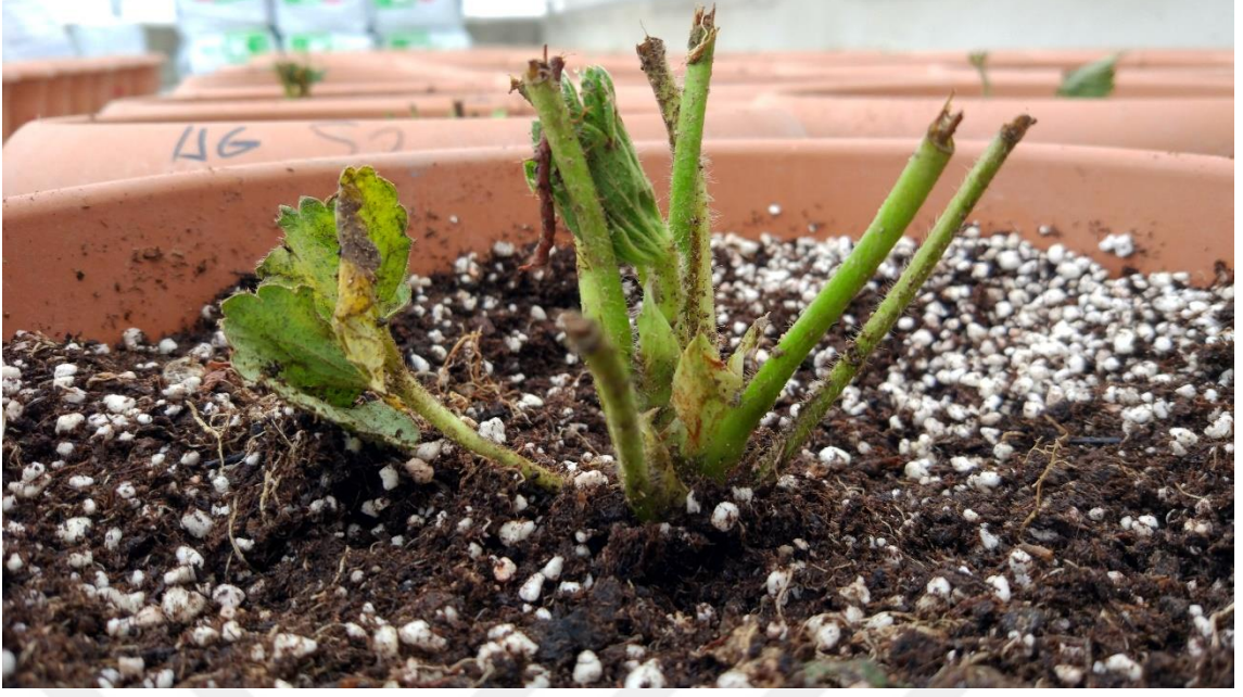
Fotoğraf 3.2. Denemede kullanılan ‘Fortuna’ çeşidine ait bitkiler