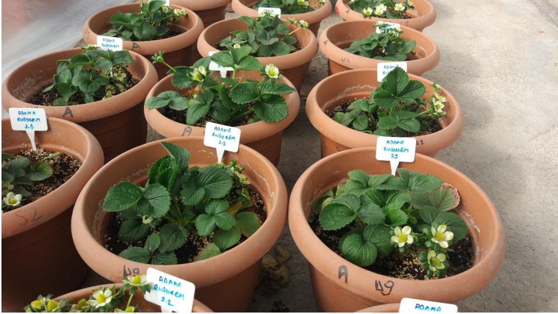
Fotoğraf 3.1. Denemede kullanılan 'Rubygem' eşidine ait bitkiler

bruising'e dayanıklılık amaçlı ıslah edilmiştir ve 'Rubygem' adlanmadan önce 'Selection 99-194' olarak ıřaretlenmiştir (Herrington vd., 2007).