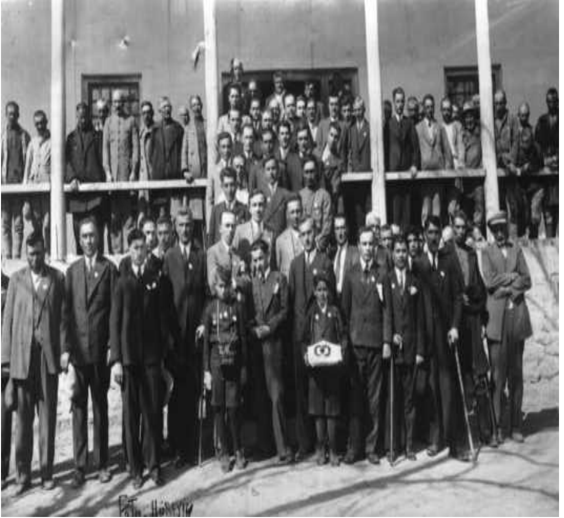
EK 1: Halkevi'nde Toplanan Halk.