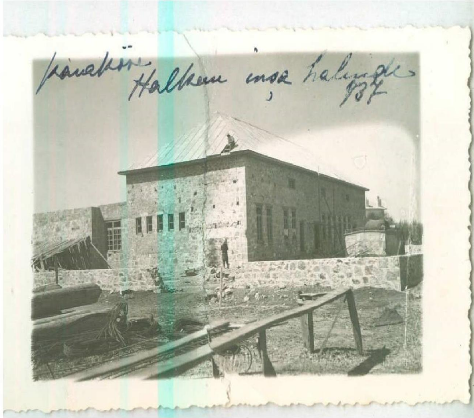
EK 10: Ağrı Karaköse Halkevi Binası İnşaatı Kartpostalı (1937)

http://urun.gittigidiyor.com/koleksiyon/1937-agri-karakose-halkevi-insaati-kartpostal-204935290