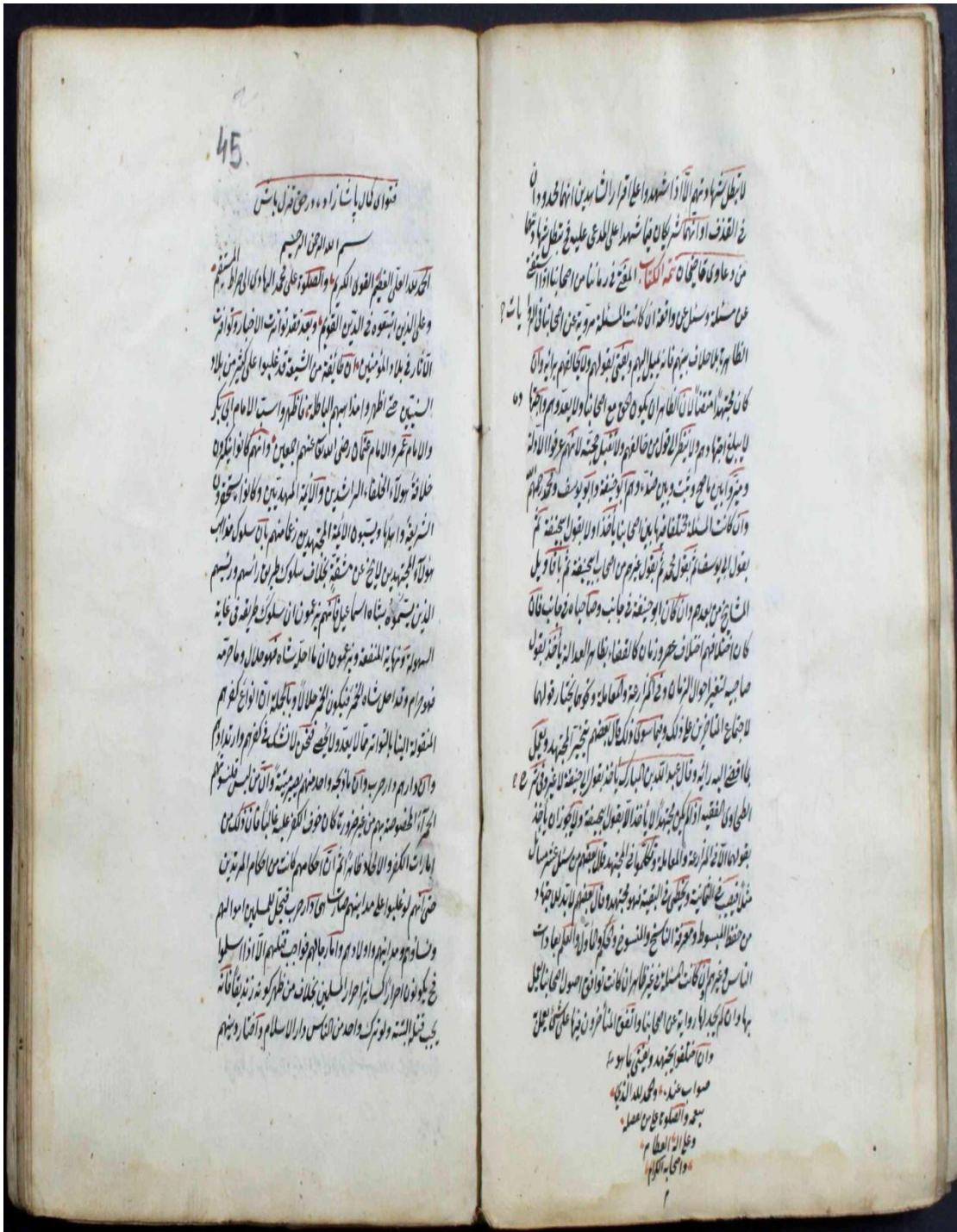
EK: 1 İbn-i Kemal'in Kızılbaşlar Hakkındaki Fetvası: Fetâva Kemal Paşazade der Hakkı Kızılbaş (1.Varak)