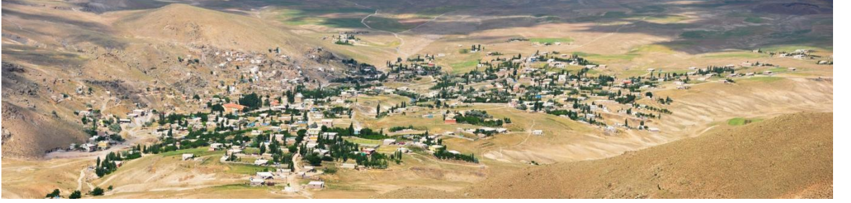
Şekil 3: Yerleşimin Göllüdağ Tarafından Görünümü.

Genel bir değerlendirme yapılacak olursa tarih, gerek savaşlar gerek coğrafi uygunluk gerek devlet politikaları gerekse de birtakım özel sebeplerden ötürü kişi veya kişilerin yaşadığı coğrafyayı kimi zaman süreli kimi zaman ise temelli terk etmelerine şahitlik etmiştir. Günümüz gelişmiş şart ve imkânlarını geriye dönük geliş sıralarına göre silme faaliyetinde bulunduğu yerleşim yeri değişikliklerini anlamak daha kolay olacaktır. Diğer birçok toplumda olduğu gibi Aleviler de konargöçer bir niteliğe sahip olmakla birlikte birtakım husumetlerin yol açtığı yolculuk ve mevsimsel coğrafi uygunluklara göre yer değiştirmelerde bulunmuşlardır.