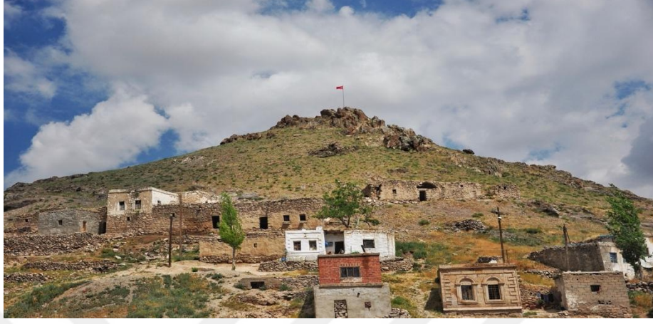
Şekil 2: Eski Yerleşim Yeri Kaletepe Mevkii.

büyük bir kısmının ticaret alanına kayması anlaşılacaktır. Süreç içinde yaşanan bu durumlar insanların ilk yerleştikleri Kaletepe (Şekil 2) mevkiinden aşağılara doğru kaymalarına neden olmuştur. Çünkü ekonomi değişmiştir.