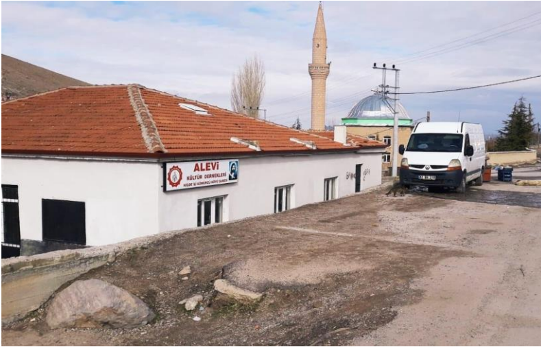
Şekil 5: Alevi Kültür Dernekleri Niğde İli Kömürcü Köyü Şubesi.