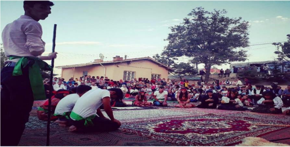
Şekil 4: Kömürcü Köyü 2018 Ceminden Bir Kare.

Önceki başlıkta dernekler arası sosyal yardımlaşmadan bahseden AE1 konuyla ilgili olarak 2018'deki cem faaliyetlerini örnek göstermiş ve birbirlerine ne gibi noktalarda yardımcı olduklarının altını çizmiştir. Cem faaliyetini gündeme gelmesi konuyla ilgili detaylı açıklama yapma durumunu incelemektedir. 2018'deki cem faaliyeti Kömürcü Köyü için her ne kadar internet haberlerinde “Bu köye ilk kez Dede gitti ve ilk kez cem tutuldu” (Pir Haber Ajansı, 2018) şeklinde bir manşetle girilmiş olsa da bu cem faaliyeti ilk değil fakat en coşkulu olanıdır. Bu durum araştırmacının sahasına gittikten sonra öğrendiği bir bilgidir ve 2018 cemi için şu aşamada Kömürcü