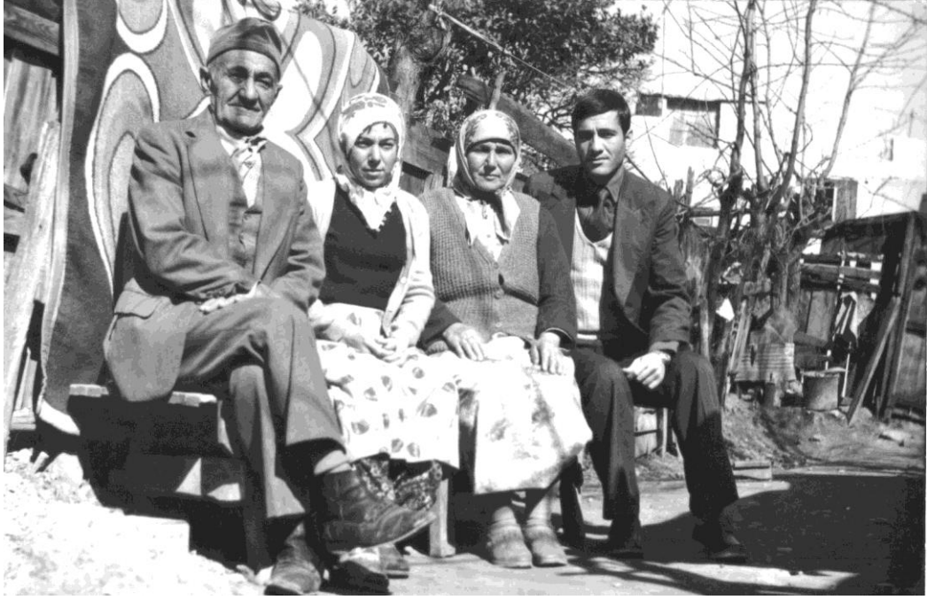
Fotoğraf 5. 1981 yılında Kıraç Ata, babası, annesi ve kardeşiyle birlikte.