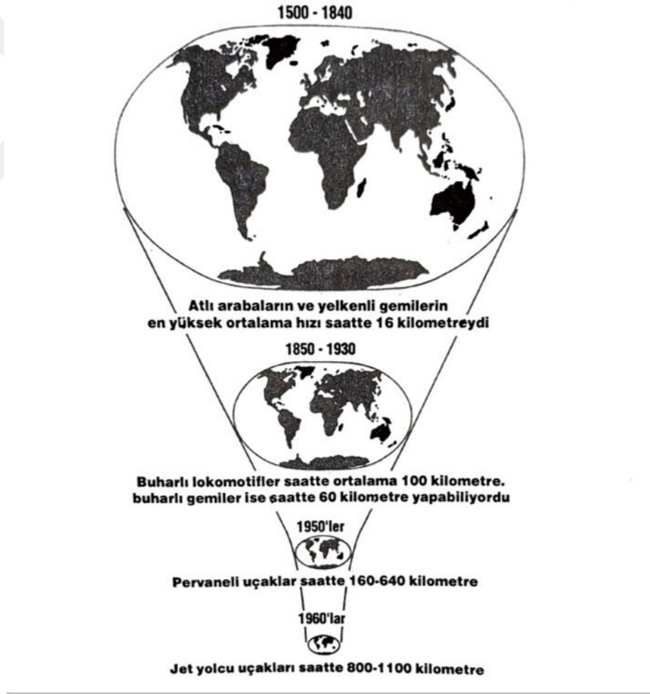
Şekil 2.1. Postmodernliğin Durumu (Harvey, 2014: 271)

“Sıkışma” terimini kullanıyorum çünkü bir yandan kapitalizmin tarihine hayatın hızının artışı damga vururken, bir yandan da mekânsal engellerin dünya sanki üzerimize çökecekmişcesine aşıldığını sağlam biçimde iddia etmenin mümkün olduğunu düşünüyorum.(...) Mekân telekomünikasyonun yarattığı bir ‘küresel köy’ e ve ekonomik ve ekolojik karşılıklı bağımlılıklardan örülmüş bir ‘uzay gemisi dünya’ ya doğru küçüldükçe ve zaman ufkumuz sonunda içinde bulunduğumuz andan başka bir şey kalmamacasına kısaldıkça( şizofrenin dünyası), mekânsal ve zamansal dünyalarımızın sıkışması duygusunun hakimiyetiyle başa çıkma zorunluluğuyla karşı karşıya kalırız( Harvey, 2014:270).